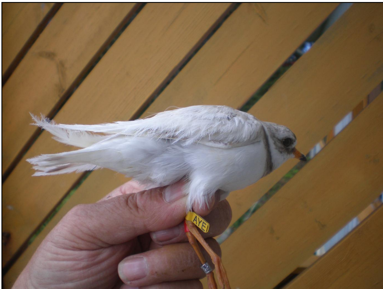
10.august 2011. Fuglen er flaggmerkt, og klar for frislepp.

der ei ung sandlo, men det var lite å få elles. Men etter to timar skjedde det: ei Kvit sandlo hang plutselig i nettet! Ho var ikkje sett der tidlegare på dagen. Det måtte vere same fuglen som Petter hadde sett dagen før. Fuglen var ikkje albino, men leukistisk, dvs at fuglen hadde ikkje raude auge, og var heller ikkje drivandes kvit over alt. Enkelte felt i brystet var mørkare brune. Fargen på nebbet og føtene viste tydeleg at det var ein gammal fugl. Det Petter elles la merke til, var at fjørene verka stivare /hardare enn hos andre sandlo. Fuglen verka ikkje så mjuk å ta i som andre. Elles viser dette tilfellet at enkelte fuglar kan klare seg bra, sjølv om det blir sagt at albino / kvite fuglar er meir utsette for predasjon, fordi dei er lettare å oppdage.